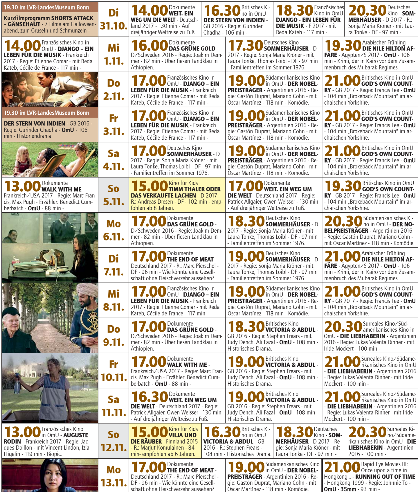
Fotos: DJANGO - EIN LEBEN FÜR DIE MUSIK / SOMMERHÄUSER / THE NILE HILTON AFFÄRE / VICTORIA & ABDUL / DIE LIEBHABERIN / RUNNING OUT OF TIME

Kreuzstraße 16 ■ 53225 Bonn-Beuel ■ www.bonnerkinemathek.de ■ f kinoinderbrotfabrik ■ 02 28 / 47 84 89